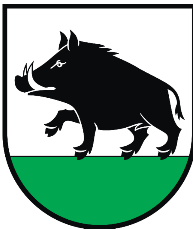
Rysunek 1. Herb Gminy Łobżenica

Herb Gminy Łobżenica przedstawia w polu srebrnym (białym) czarnego dzika, krocącego w prawo (heraldycznie) na zielonej murawie. Murawa ta zajmuje 1/3 wysokości pola tarczy herbowej. Symbol ten stanowi własność Gminy Łobżenica i jest znakiem prawnie chronionym.