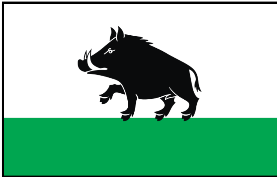
Rysunek 2. Flaga Gminy Łobżenica

Flagę Gminy Łobżenica stanowi prostokątny płat tkaniny, składający się z dwóch pasów – białego u góry i zielonego na dole. Na środku białego pasa umieszczony jest herb Gminy Łobżenica, czyli czarny, kroczący dzik. Symbol ten stanowi własność Gminy Łobżenica i jest znakiem prawnie chronionym.