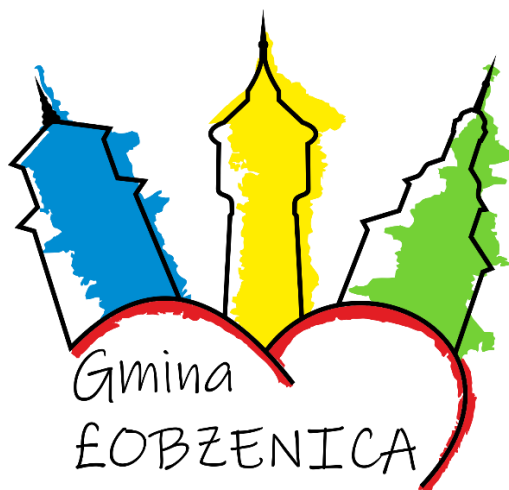
Rysunek 4. Logo Gminy Łobżenica