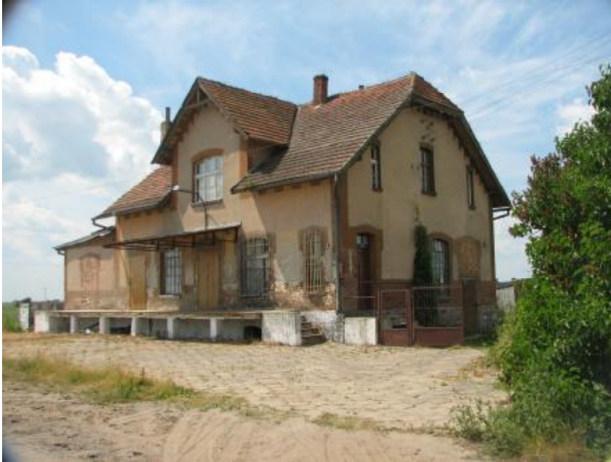
Rysunek 1. Budynek po byłej mleczarni