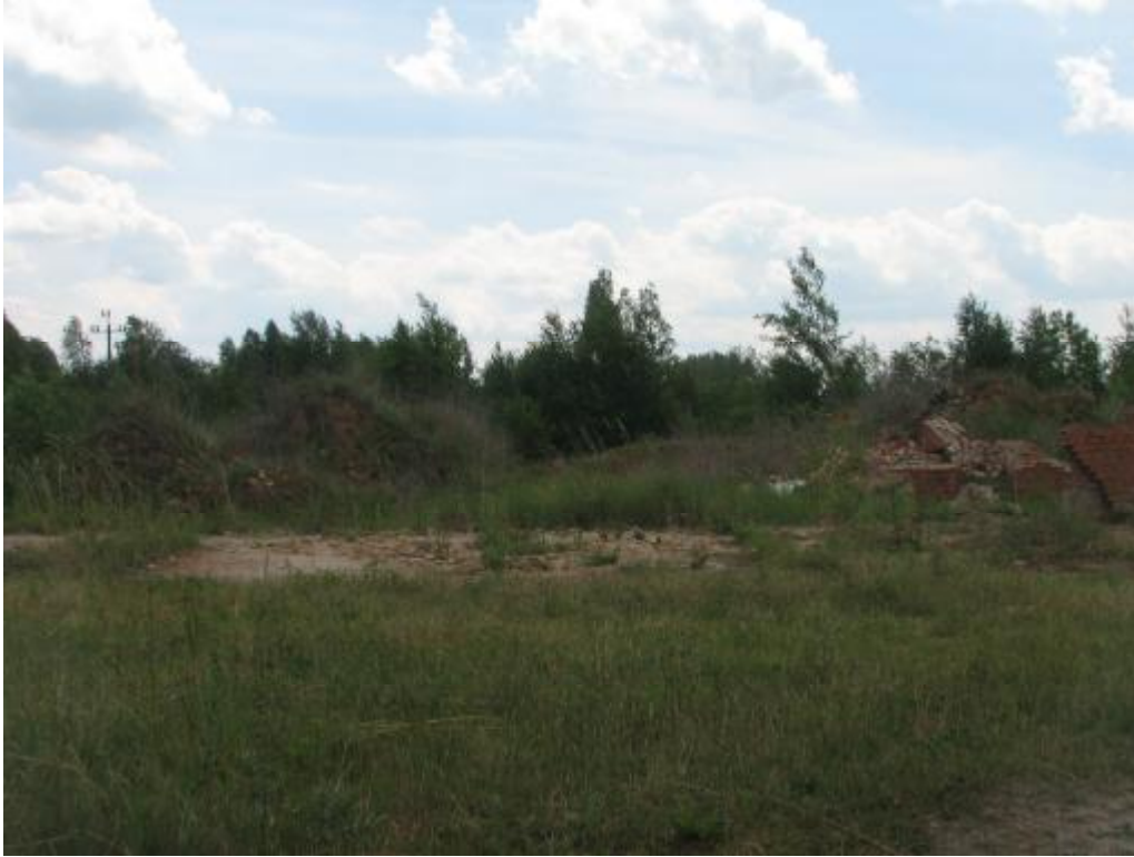
Rysunek 3. Miejsce po byłej cegielni