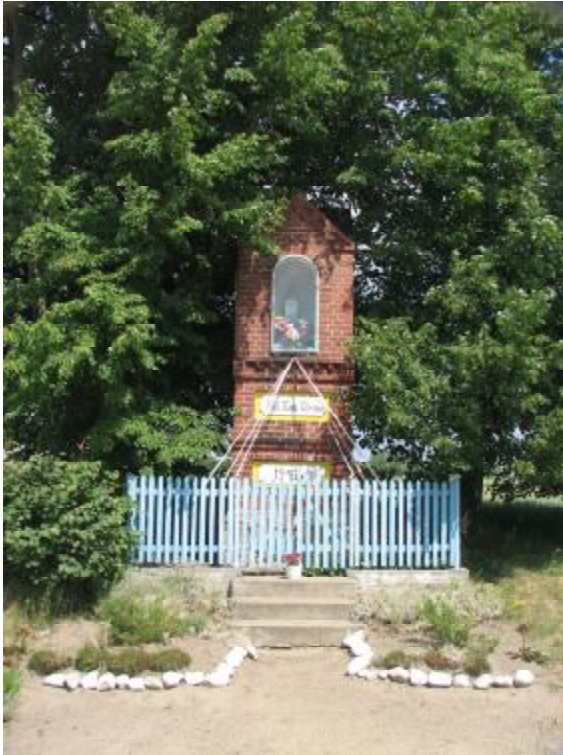
Rysunek 4. Kapliczka z 1946 roku w Kruszkach