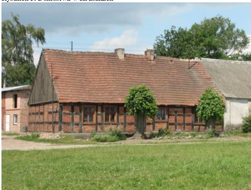
Rysunek 3. Domostwa w Kruszkach