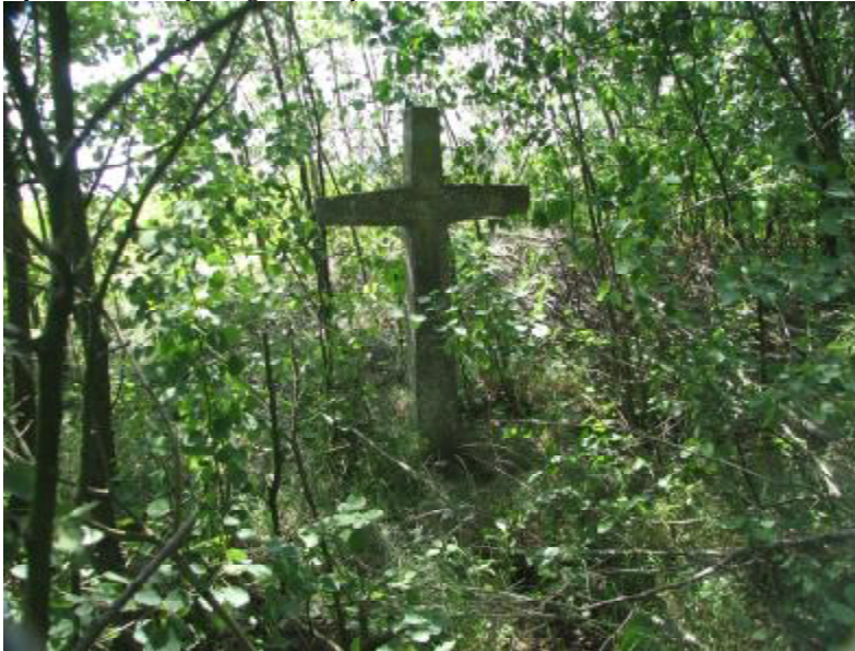
Rysunek 1. Krzyż nagrobkowy – cmentarz w Kruszkach

Jest to drugi z cmentarzy na terenie Kruszek. Jego stan jest zaniedbany. Wymaga odpowiednio zagospodarowania. Jest to tym bardziej istotne, gdyż jako jeden z nielicznych na terenie gminy Łobzenica, cmentarz ten posiada pozostałości dawnych nagrobków.