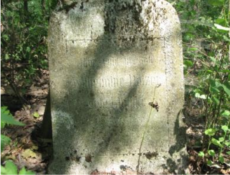
Rysunek 2. Krzyż nagrobkowy – cmentarz w Kruszkach