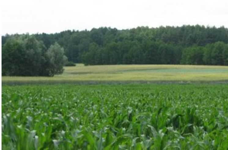
Rysunek 2. Okolice miejscowości Kruszki