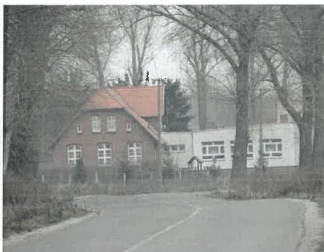
Szkoła podstawowa w Fanianowie