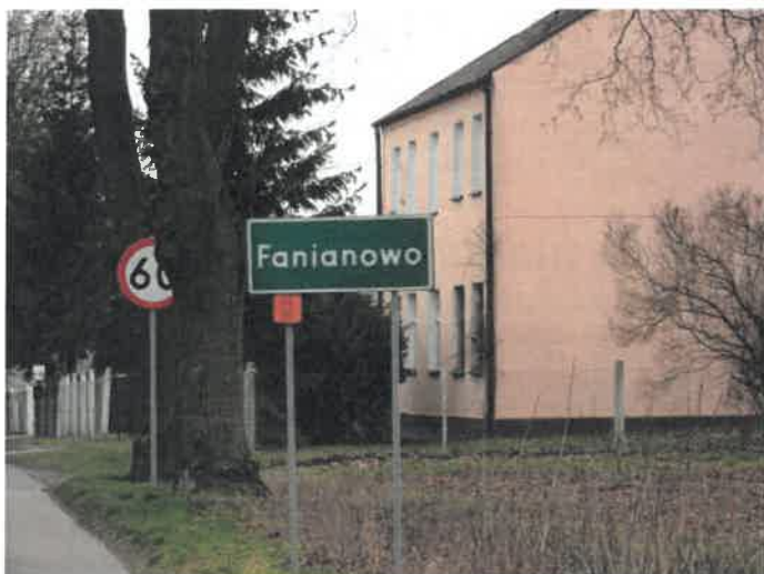
Fanianowo – ścieżka międzynarodowa R-1