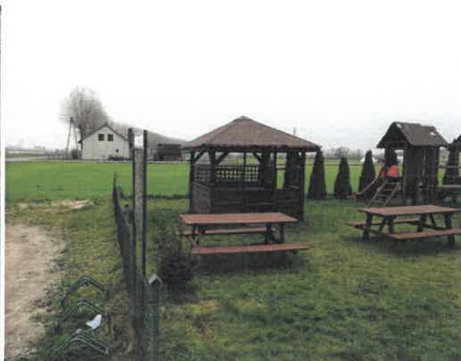
Teren rekreacyjny w Fanianowie