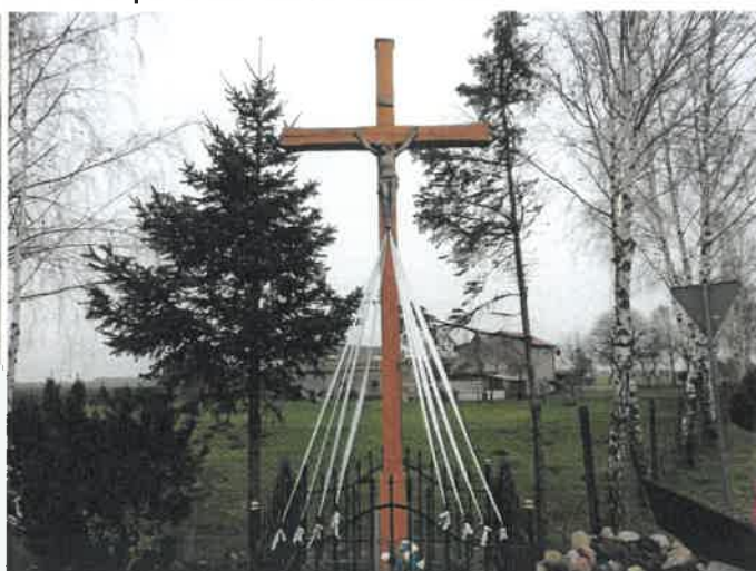
Miejsce kultu religijnego w Fanianowie