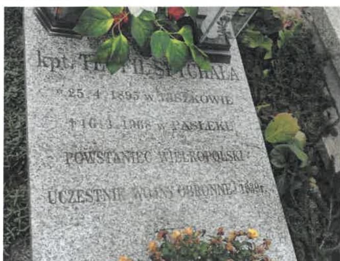
Grób Powstańca Wielkopolskiego