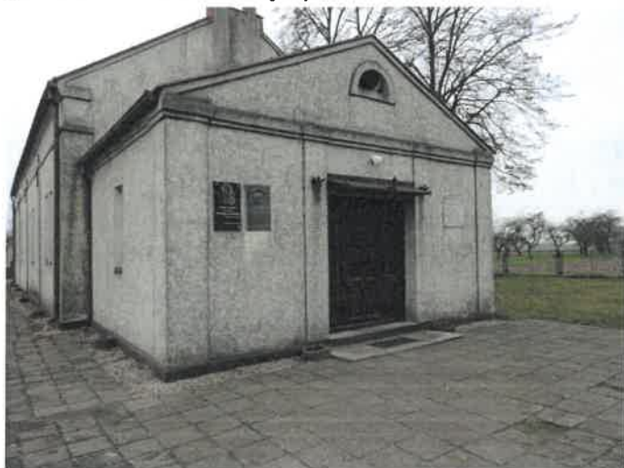
Kościół w Fanianowie