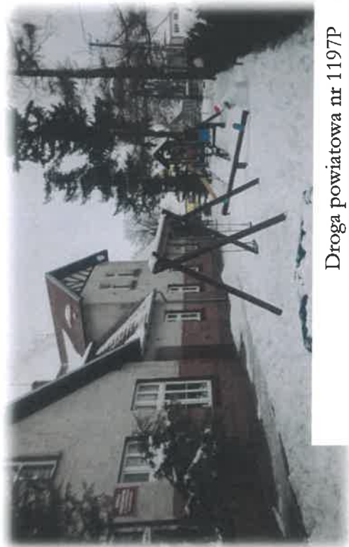
Droga powiatowa nr 1197P