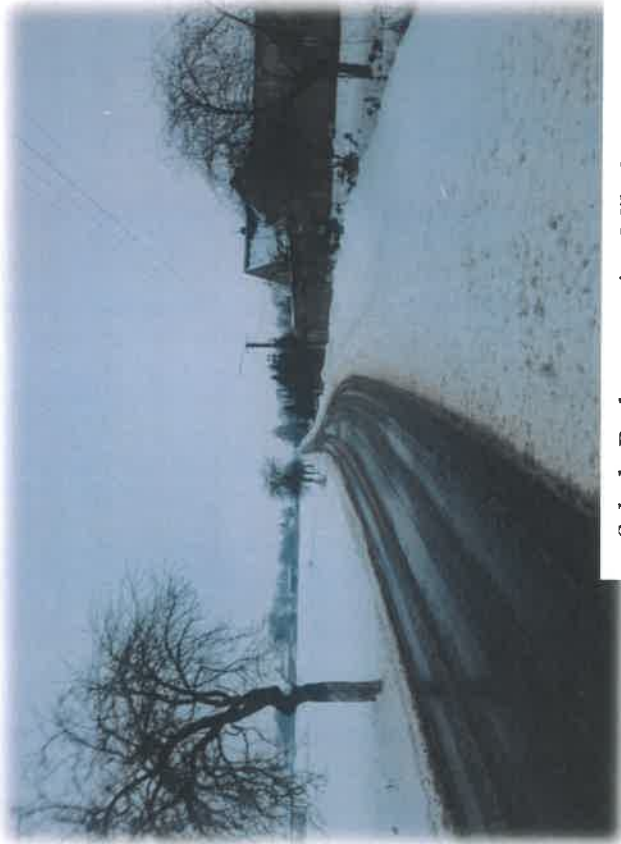
Szkoła Podstawowa im. Mikołaja Kopernika

Z przeprowadzonej wizji w terenie sporządzono dokumentację fotograficzną (płyta CD).