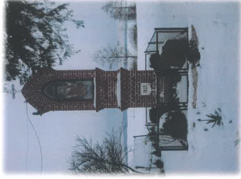
Figura Serca Jezusowego

Wiktorówko, to wieś usytuowana trzy kilometry na zachód od Łobżenicy, na terenie równinnym nad rzeką Kocuń i jeziorem Sławianowskim Wielkim. Położona jest wzdłuż dróg powiatowych i gminnych, rozciągnięta na 6km. W odległości ok. 1km od naszej miejscowości znajduje się najstarsze Sanktuarium Maryjne w Polsce Bazylika Mniejsza w Górze Klasztornej. Historia powstania wsi sięgają pierwszej połowie XIX wieku. Początkowo zamieszkiwali, tu osadnicy niemieccy. Pozostałością po tamtych czasach są liczne zabytkowe zabudowy po niemieckie, będące w większości własnością prywatną. We wsi znajduje się Szkoła Podstawowa im. Mikołaja Kopernika, której budynek częściowo jest pozostałością po dawnych czasach. Aktywni mieszkańcy tej wsi są skupieni w Gminnej Radzie Kobiet przy Stowarzyszeniu Gminnej Rady Kobiet w Łobżenicy, Ochotniczej Straży Pożarnej i Stowarzyszeniu Zwyczajnym na Rzecz Rozwoju Wsi Wiktorówko. Wieś jest zwodociągowana, ale nie skanalizowana. Ważnym elementem integracji mieszkańców są miejsca ich spotkań, do których należy sala OSP oraz tworzone obecnie miejsce integracji przy boisku wiejskim. Słabo doposażone miejsce integracyjno-sportowe uniemożliwia aktywne formy spędzania czasu wolnego przez dzieci, młodzież i dorosłych. Warto dbać o rozwój tej wsi, jest ona bowiem miejscem bardzo atrakcyjnym zarówno pod względem zarówno turystycznym, jak i historycznym jak i kulturalno-społecznym.