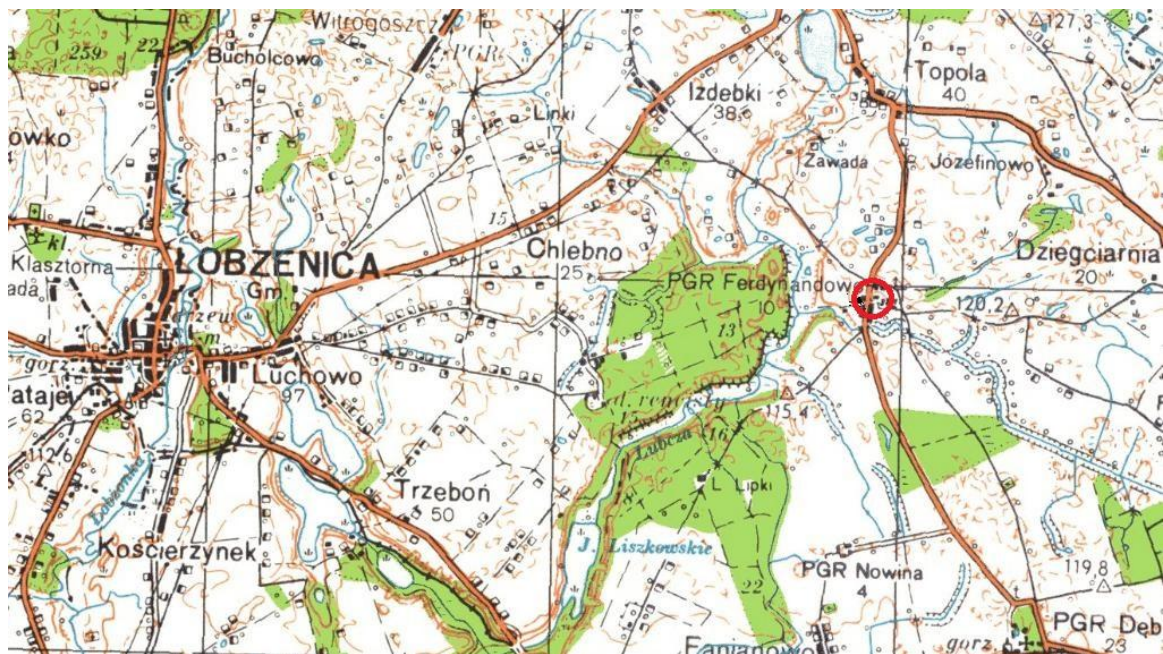
Rysunek 1 – Lokalizacja obszaru opracowania planu.