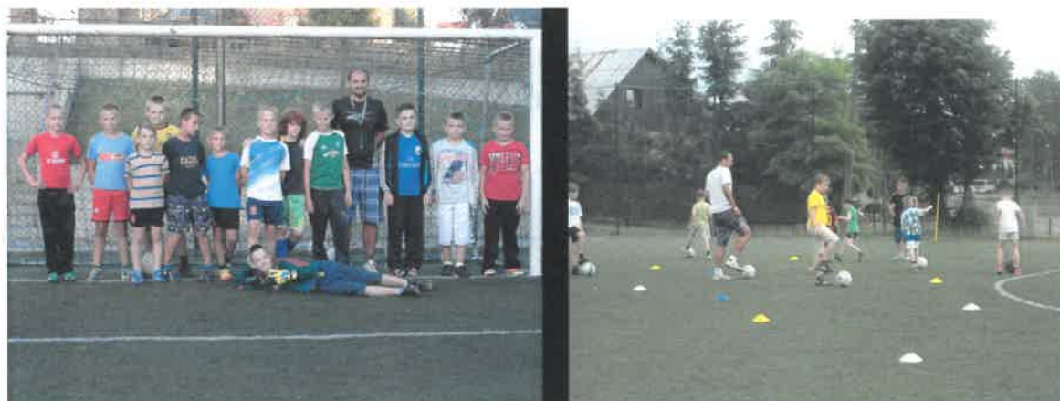
Uczestnicy inicjatywy lokalnej „Wakacje z piłką”

Kolejną inicjatywą lokalną o charakterze sportowym było przedsięwzięcie pn. „Wakacje z piłką” Ludowego Zespołu Sportowego Jedność Łobzenica.