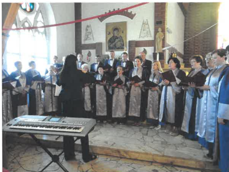
Uczestnicy inicjatywy „Promujemy Krajnę – 700 nutek na 700-lecie”

Drugi projekt „Promujemy Krajnę – 700 nutek na 700-lecie” Towarzystwa śpiewacze Magnificat dotyczył promowania gminy w kraju poprzez wykonywanie swoich utworów w miejscowości nadmorskiej Gdańsk, Klincz i Żelistrzewie.