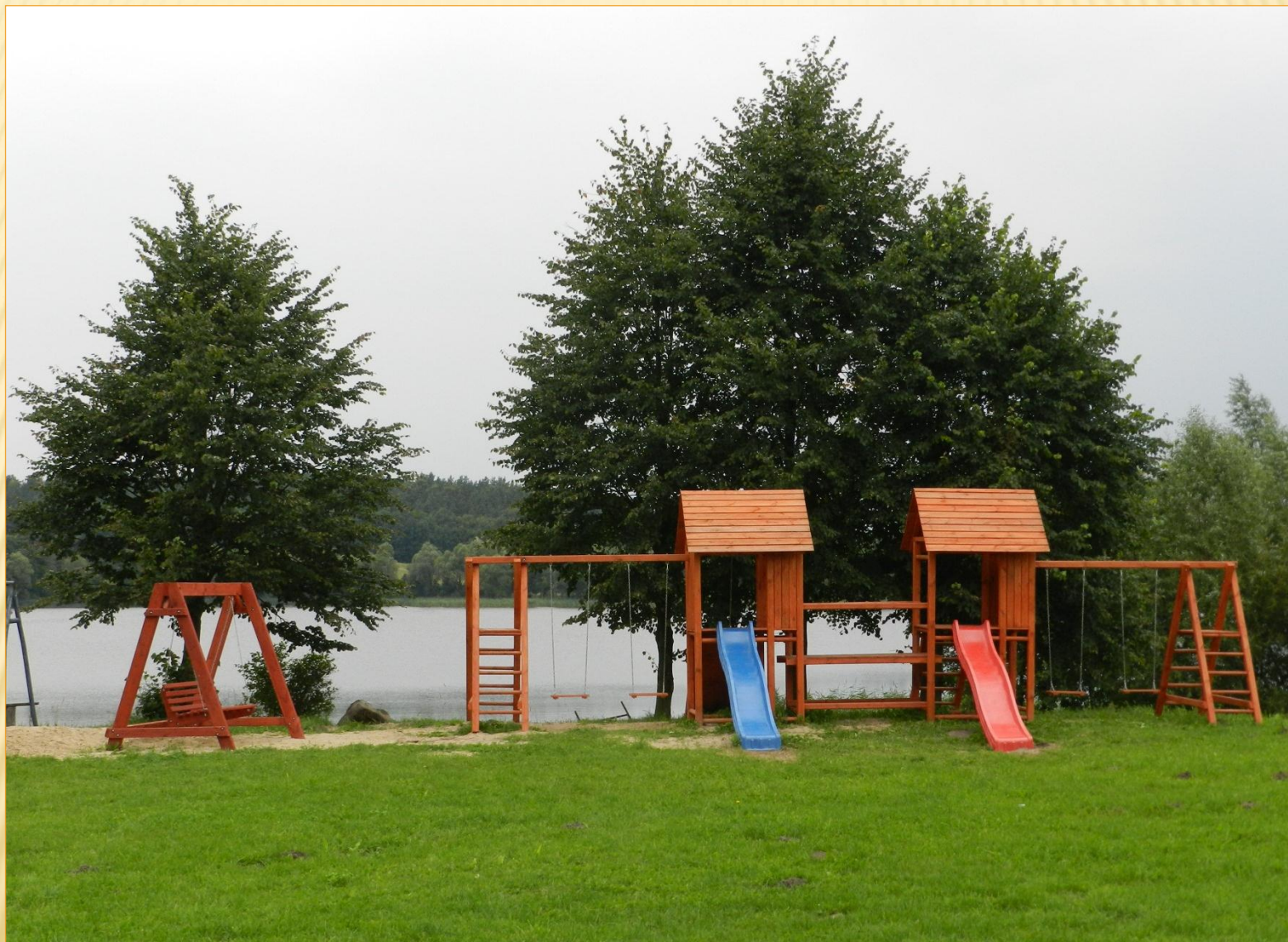
PLAC ZABAW DŹWIERSZNO WIELKIE