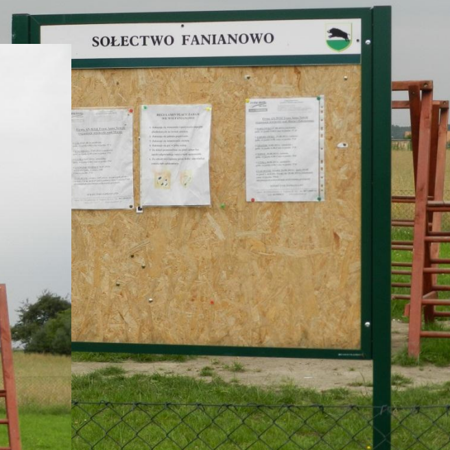
PLAC ZABAW FANIANOWO