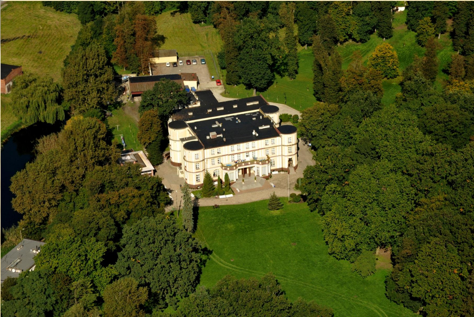
Dębno - Pałac