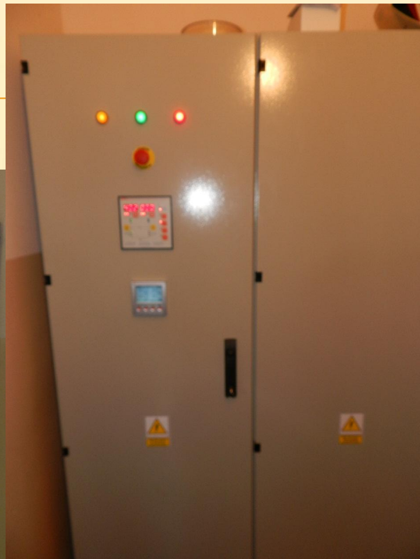
OCZYSZCZALNIA ŚCIEKÓW W LISZKOWIE – SYSTEM AKPiA