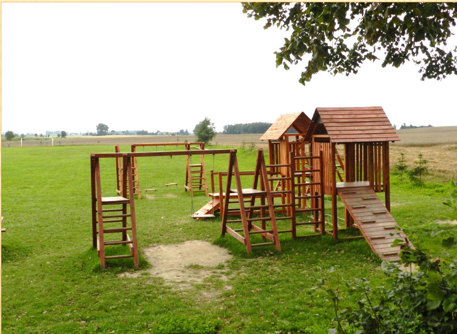
PLAC ZABAW – WITROGOSZCZ - OSADA