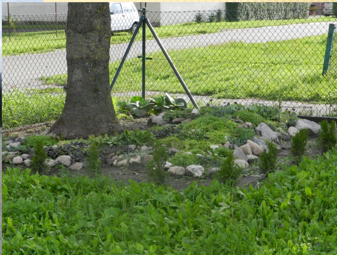
PLAC PRZED ŚWIETLICĄ WIEJSKĄ – SZCZERBIN