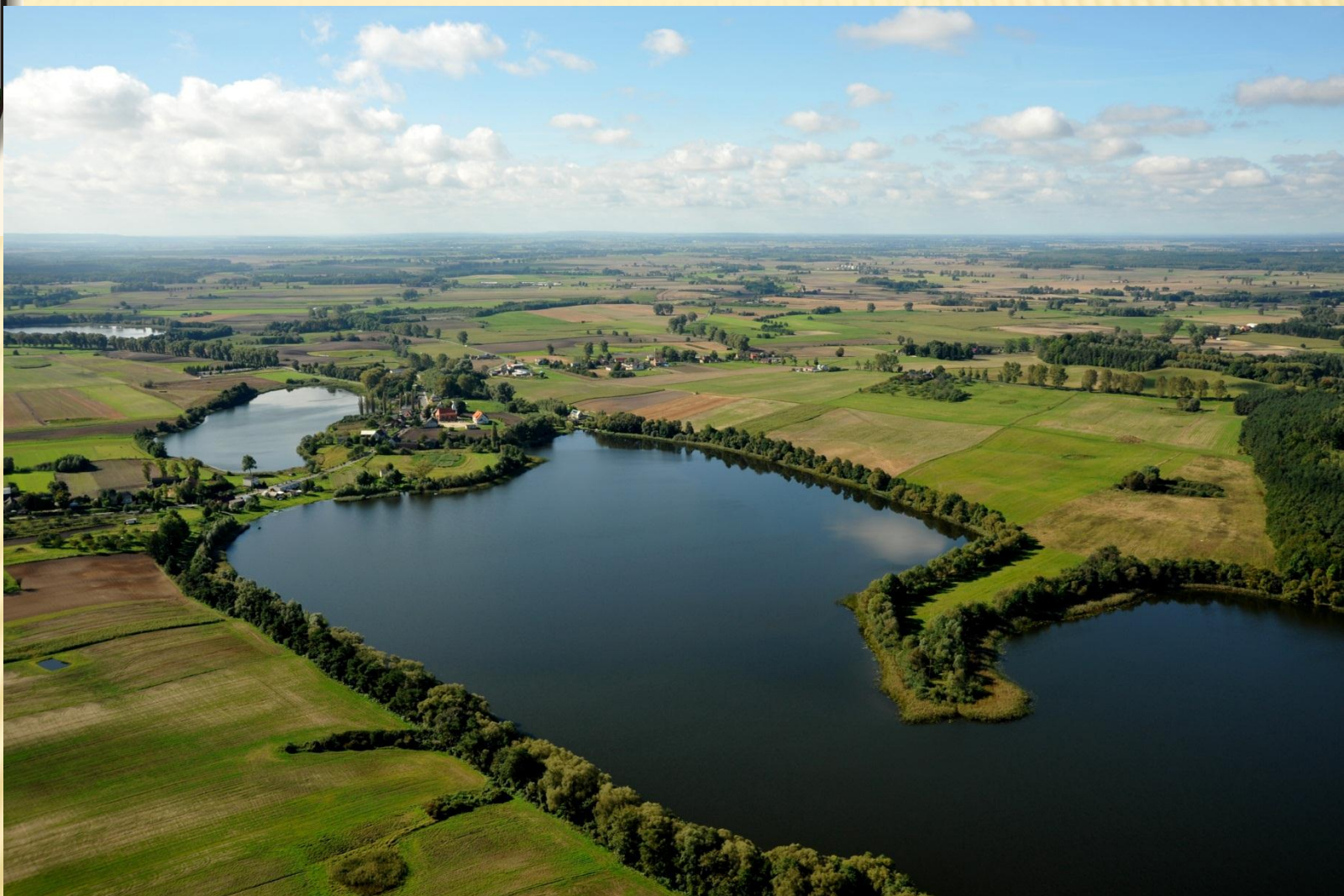
Jezioro Stryjewe, Dźwierzno Wielkie