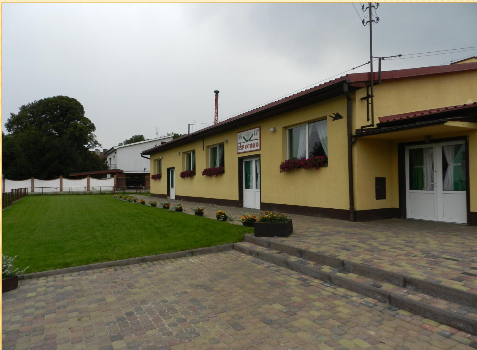
ZAGOSPODAROWANIE TERENU PRZED ŚWIETLICĄ WIEJSKĄ - WIKTORÓWKO