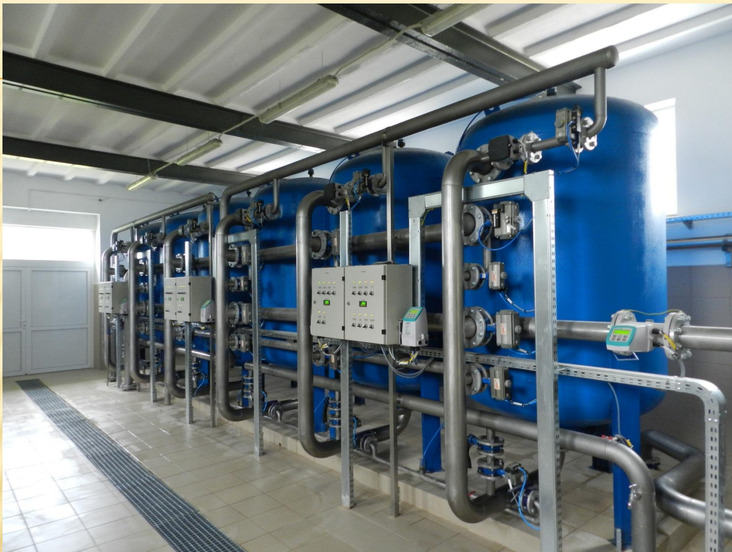
STACJA UZDATNIANIA WODY W DŹWIERSZNIIE WIELKIM